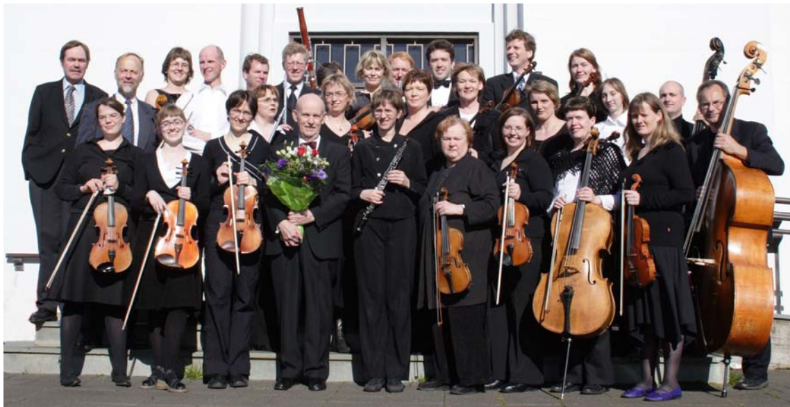
Sinfóníuhljómsveit áhugamanna fyrir framan Skálholtskirkju eftir tónleika 14. maí 2005

„...lát tónlistina taka í hönd yðar og veita yður gleði...“