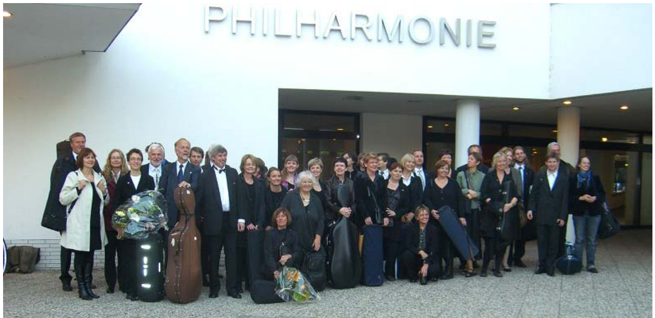
Félagar úr Sinfóníuhljómsveit áhugamanna og Orchester Berliner Musikfreunde fyrir framan Philharmonie eftir tónleika 28. september 2008