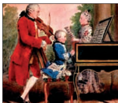
Leopold Mozart með fiðluna, undrabarnið Wolfgang Amadeus Mozart við sembalinn.

Ludwig van Beethoven (1770-1827) samdi tónlist við leikritið „Rústir Apenuborgar“ eftir August von Kotzebue sem flutt var við vígslu nýs leikhúss í Pest árið 1811. Verkið samanstendur af forleik og átta köflum og er sjaldan flutt í heild. Forleikurinn heyrir þó oft og tyrkneski marsinn er vel þekktur. Í leikritinu hafa Tyrkir sigrað Apenuborg og lagt hana í rúst. Áhorfendur láti þó ekki hugfallast því listirnar blómstra í Búdapest! Tyrknesk herlúðrasveit nálgast, gengur framhá og fjarlægist.