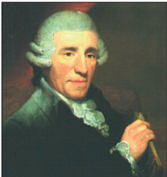
Haydn, málverk frá 1792.

var saminn 1775 og frumfluttur um jólaleytið. Hafi Mozart sjálfur leikið hann, fer ekki milli mála að 19 ára unglingurinn hefur verið býsna sleipur fiðlari. Konsertinn er stundum kallaður Tyrkneski konsertinn vegna lokakaflans. Hann er saminn í dæmigerðu rondó-formi en bregður skyndilega á leik með tyrknesku innskoti. Strengjaleikararnir slá strengina með öfugum boganum og hljómagangurinn verður framandlegur. Þó Leopold hafi hvatt son sinn til dáða við fiðluleikinn var Mozart aldrei sérstaklega áhugasamur. Hann sýndi raunar víólunni meiri áhuga og lék gjarnan á hana á mannamótum. Frægt er þegar einn af kvartettum Mozarts var fluttur í Vínarborg. Þar léku Haydn og Dittersdorf á fiðlur og Mozart á víólu. Það hefur líklega ekki verið leiðinlegt að vera sellóleikari í þeim kvartett.