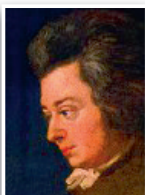
Wolfgang Amadeus Mozart

Ein af furðum menningarsögunnar er hvernig listsköpun blómstrar stundum á afmörkuðum svæðum og í takmarkaðan tíma. Til verður fjöldi ódauðlegra listaverka, gerð af hópi fólks sem oft þekktist vel innbyrðis og skiptist á hugmyndum og skoðunum. Best þekkt dæmið um þetta er líklega hið svokallaða klassíska tímabil tónsköpunar í Vín á átjándu og nítjándu öld. Sem dæmi úr íslenski menningarsögu má ef til vill nefna ritunartíma Íslendingasagna á þrettándu og fjórtándu öld og blómatíma sönglagagerðar á fyrri hluta tuttugustu aldar. Í dag ætlum við að gera Vínarklassíkinni nokkur skil og leikum verk eftir Mozart (1756 – 1791), Beethoven (1770 – 1827) og Haydn (1732–1809), sem stundum eru nefndir höfuðskáld klassíkurinnar. Þeir þekktust allir vel þótt á þeim væri allnokkur aldursmunur. Gagnkvæm áhrif á tónsköpun þeirra fer ekki milli mála.