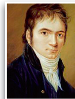
Beethoven um það leyti sem hann samdi þriðja pianókoncertinn

Wolfgang Amadeus Mozart (1756–1791) leit á Haydn sem læriföður sinn og með þeim var mikill vinskapur. Mozart gerðist félagi í Frímúrarareglunni 1784 og fékk þar skjótan frama. Nokkur af verkum hans voru samin sérstaklega fyrir athafnir á vegum reglunnar og önnur hafa sterk tengsl við hana, svo sem Töfraflautan og Sálumessan. Maurerische Trauermusik er sorgartónlist og var samin til flutnings við útför tveggja reglubræðra 1785. Bassethorn og kontrafagott gefa tónlistinni mildan og djúpan sorgarblæ sem minnir óneitanlega á Sálumessuna.